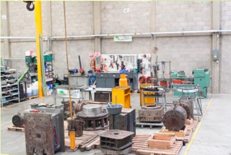
Taller de mantenimiento

Contamos con amplias instalaciones equipadas con todo lo necesario para el cuidado de su propiedad, moldes, materia prima, productos, etc.