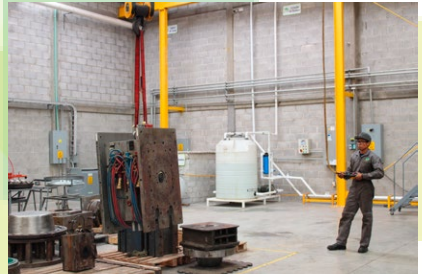
Grúa viajera 5 TN