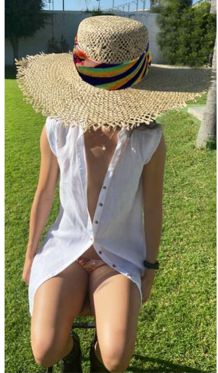
Phuket Bag Kyuma Hat