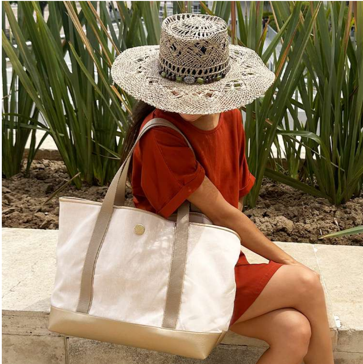
Phuket Bag Mare Hat