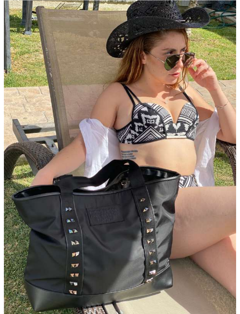
Aruba Bag Kiara Hat